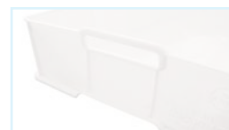
Particolare della PC10 Details of PC10

Tutte le casse "TAL F6646" - "AC2" - "PF10-PC10" possono essere personalizzate con marchio a caldo All boxes of "TAL F6646" - "AC2" - "PF10-PC10" and of are customizable by hot printing