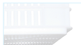
Feritoie pareti / wall perforations Dim. 28x4 mm