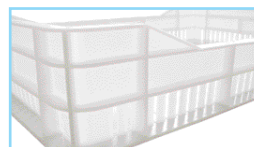
Feritoie / perforations Dim. 28x5 mm