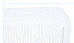
Feritoie fondo / bottom perforations Dim. 65x4 mm